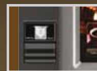
Accepteur de billets