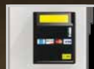
Lecteur de carte de crédit